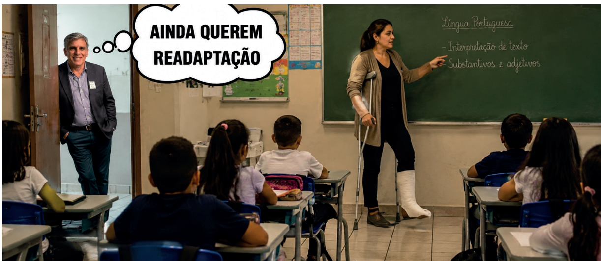
DIFICULDADES - Servidores não conseguem acesso a readaptação mesmo com decisão judicial favorável obtida pela ATEM

Segundo a Ação Civil Pública ajuizada pela entidade, o Município passou a