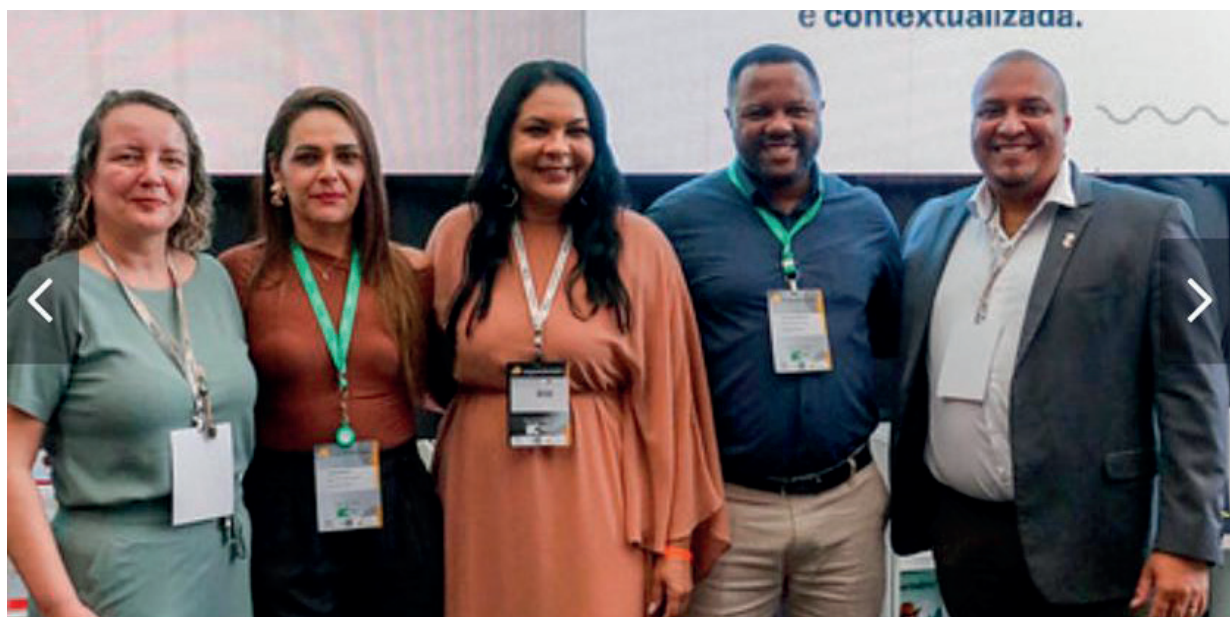
ENCONTRO - Secretária da Educação durante encontro com representantes da Editora Ática durante evento em rio Preto

Outro ponto sensível envolve os preços praticados. Comparações nacionais